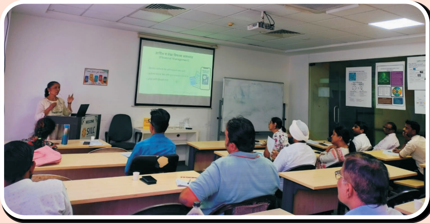
सकाळ मॅनेजर ट्रेनिंग दिनांक १७ एप्रिल २०२६